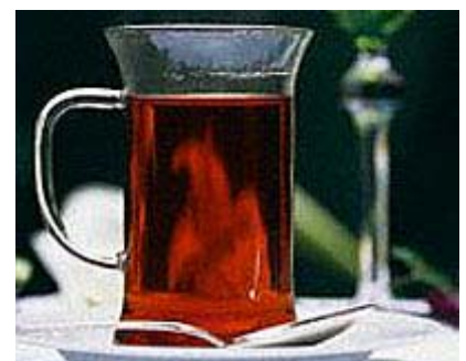
Heißer Glühwein regt die Immunabwehr der Schleimhäute an.